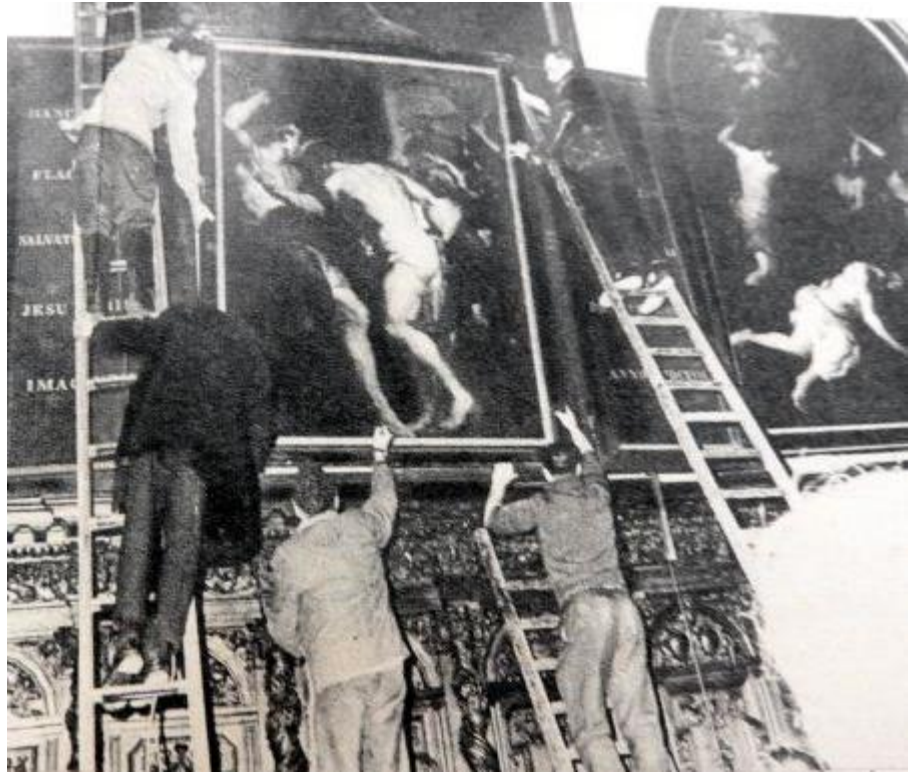
Schilderij 'De geseling' van Rubens wordt gered door vrijwilligers, Sint-Pauluskerk Antwerpen